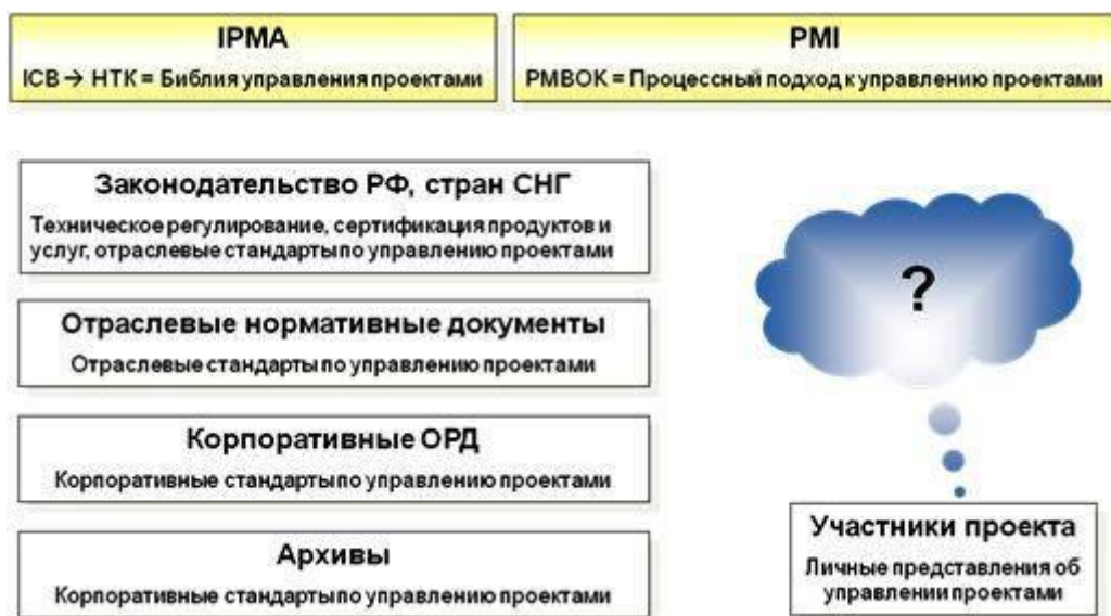
Рис. 1. Нормативные основы проектного менеджмента в РФ

Географически, ландшафтно, лингвистически, климатически, культурно и религиозно Россия является синтетическим единением евразийского Запада и евразийского Востока, причем ее геополитическая функция не сводится к суммированию или опосредованию западных и восточных тенденций. Россия есть нечто «третье», самостоятельное и особое, ни Восток, ни Запад. Культурно осмыслявшие "срединное" положение России русские евразийцы говорили об особой культуре "Срединной Империи", где географические и геополитические противоположности снимаются в духовном, вертикальном синтезе. С чисто стратегической точки зрения, Россия тождественна самой Евразии хотя бы потому, что именно ее земли, ее население и ее индустриально-технологическое развитие обладают достаточным объемом, чтобы быть базой континентальной независимости, автаркии и служить основой для полной континентальной интеграции, что по геополитическим законам должно произойти с каждым "островом", в том числе и с самим "Мировым Островом" (World Island), т.е. с Евразией.