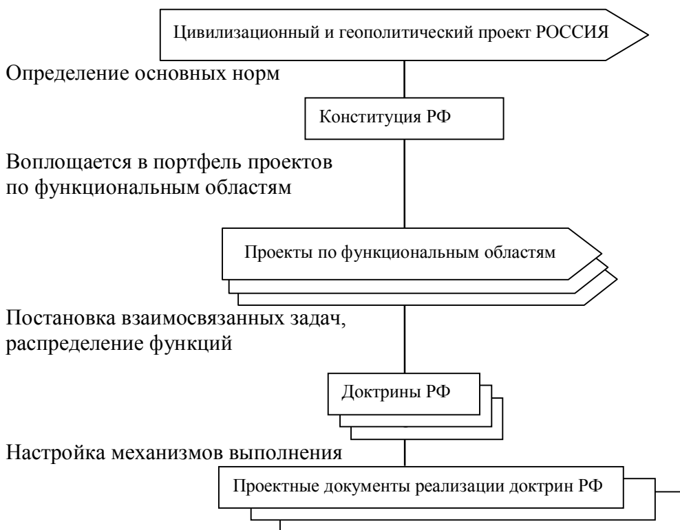
Рис.2. Схема инструментализации КДР

В результате мы получим возможность сформировать стройную систему проектов развития РФ и обеспечивающих нормативных документов (рис. 2).